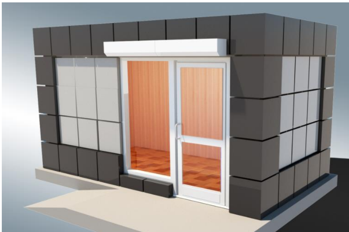
Тип «Современный» С8